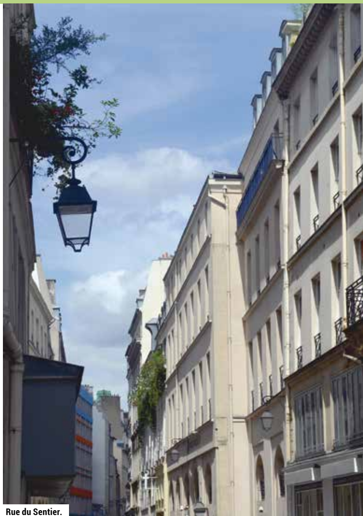
Rue du Sentier.