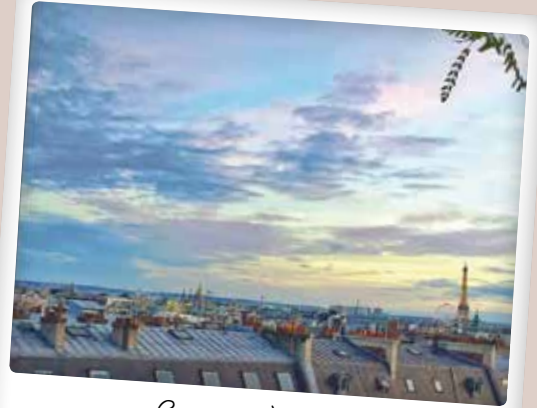
Coucher de soleil