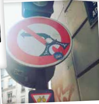
Interdiction de tourner par @parigigina