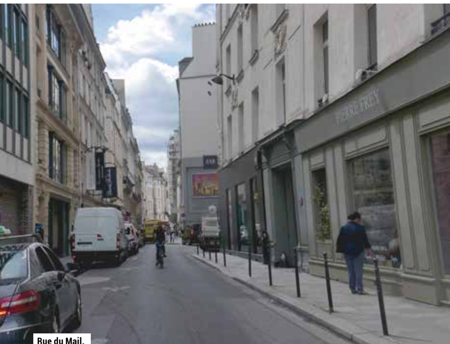
Rue du Mail.

Le PLU acte la fin de la densification de Paris, la végétalisation de ses espaces publics et la création de logements, notamment en transformant des bureaux inoccupés. Si ce document est essentiel pour dessiner le paysage urbain de demain, il va bien au-delà des questions d'urbanisme. La moitié de la population mondiale vit en ville. Le projet écologiste consiste à mettre l'être humain en son cœur. Il s'agit de créer un paysage urbain qui ne soit pas entièrement tourné vers le productivisme, dans lequel règne l'harmonie, tant dans les relations humaines qu'avec notre environnement. Comment ? Notamment en faisant revenir la nature en ville et en préservant des lieux de rencontres et de détente, à l'abri de la circulation des voitures. À l'instar de notre projet de travaux sur la placette dite "du Figaro". Le PLU permet de s'assurer que la ville de demain sera aménagée en fonction de principes qui nous semblent fondamentaux, tels que la convivialité, la solidarité et le vivre-ensemble.