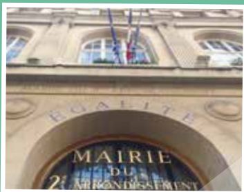
Hommage Au lendemain du 14 juillet, le 2 e solidaire de Nice.