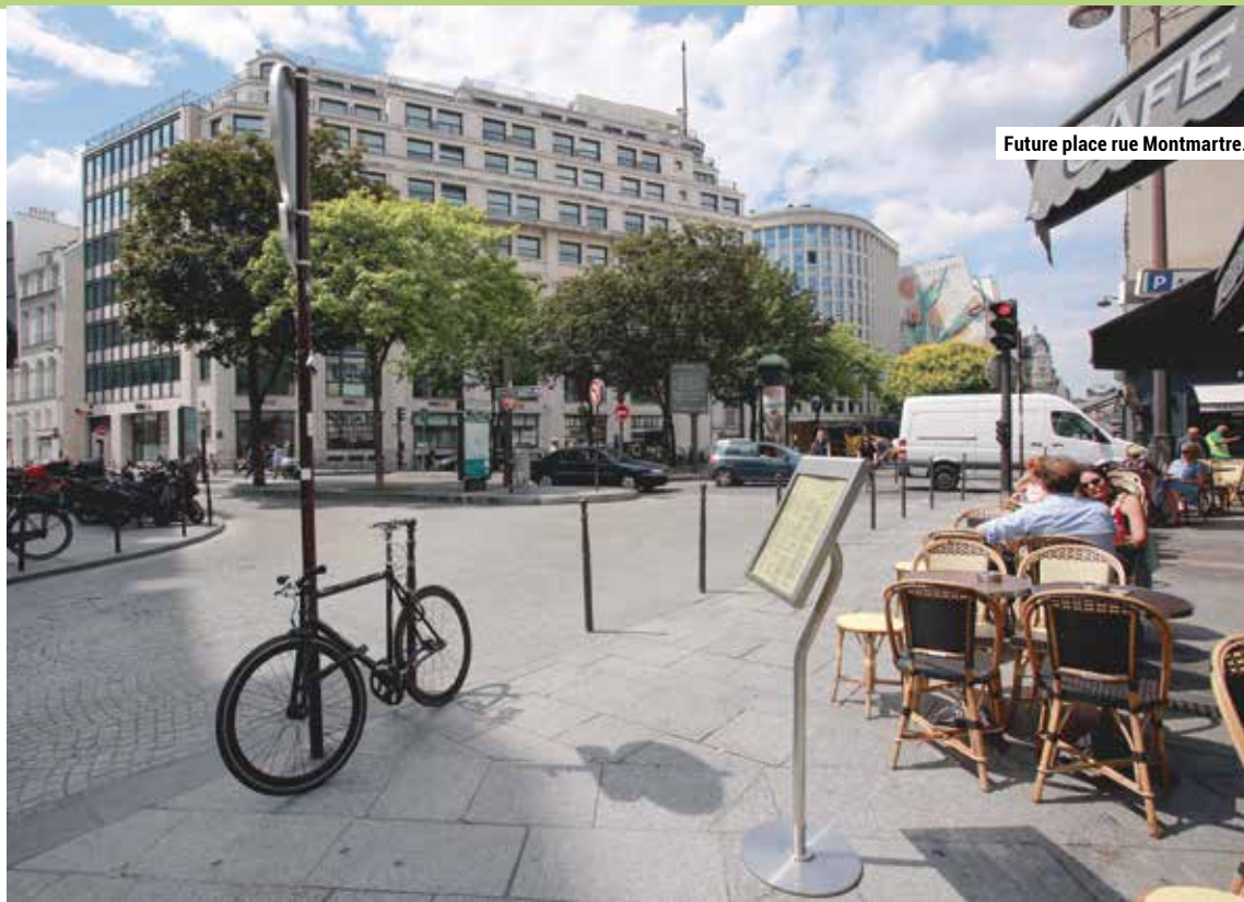
Future place rue Montmartre.