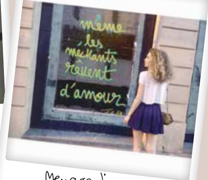
Message d'amour par @namasteclemence