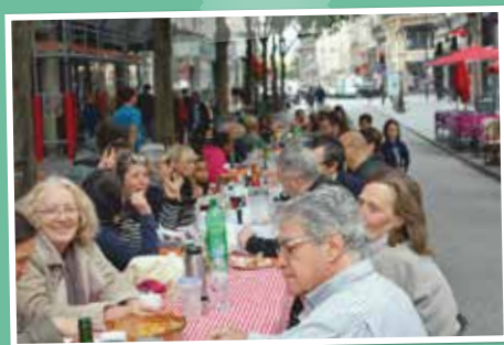
Pique-nique Rue Montmartre à l'invitation d'Air2Fête.