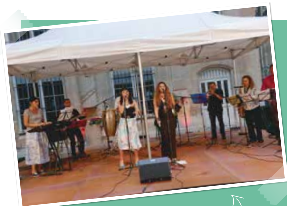
Fête de la musique en mairie, salsa jusqu'à la tombée de la nuit !