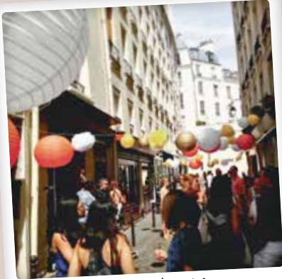
Fête rue du Nil par @volienel

N'hésitez pas à nous adresser vos clichés par courriel à mairie02@paris.fr ou sur Instagram avec #Paris02. Et n'oubliez pas de suivre @Mairiedu2 !