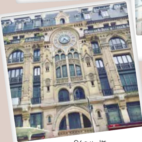
Rue Réaumur par @ines_ak